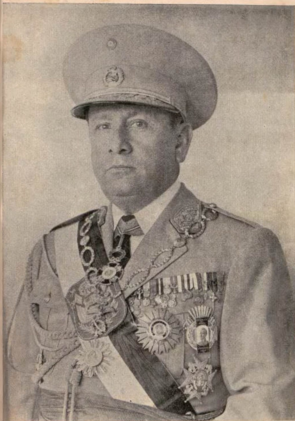
SEÑOR GENERAL DE DIVISION DN. MANUEL A. ODRÍA Presidente Constitucional de la República