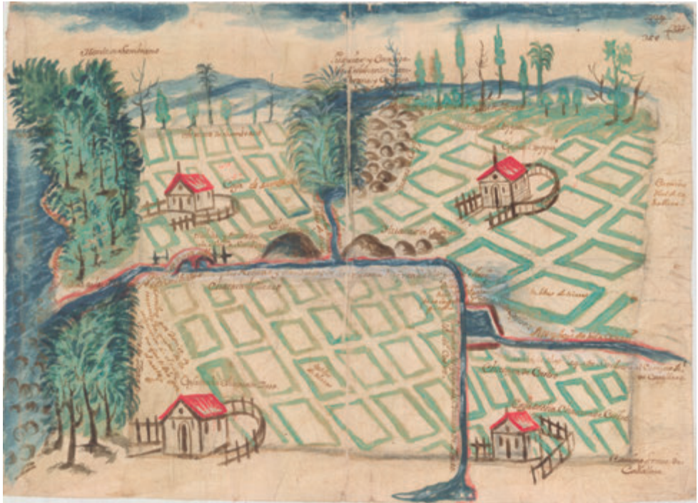
Fig. 4. Planoteca, PL 97, Croquis de la hacienda Zambrano y otros con sus linderos en Collique, año 1718.