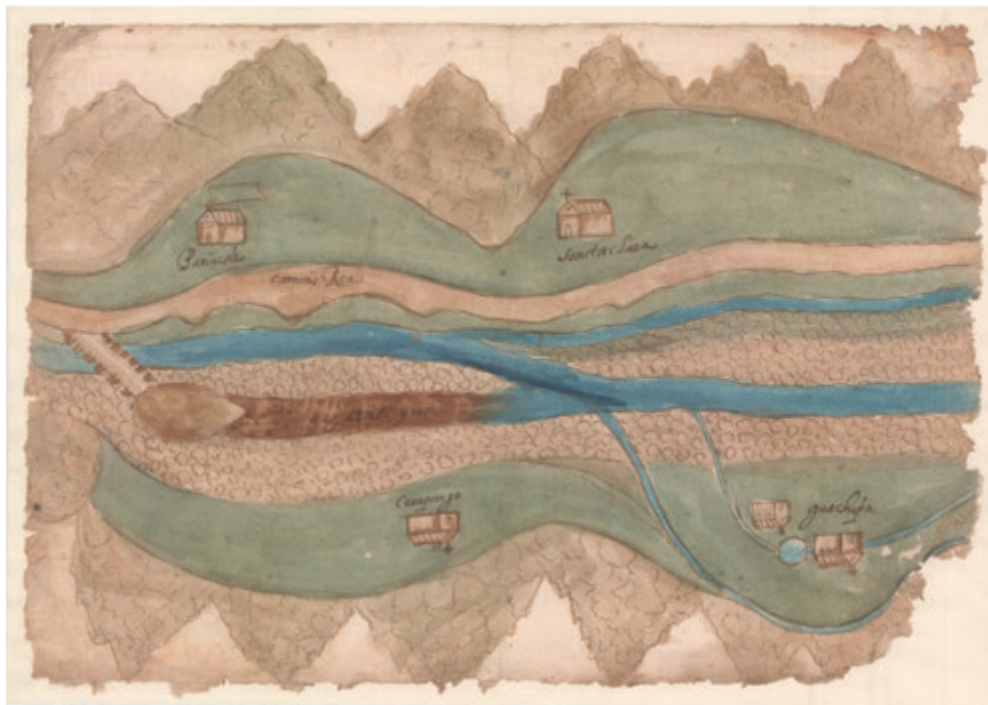
Fig. 2. Planoteca, PL 101, Plano sobre una visita realizada al río Pariachi en el valle de Huanchihuaylas, año 1654.