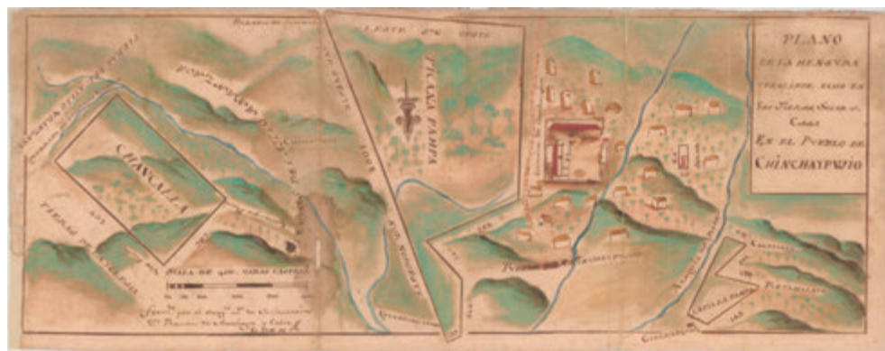
Fig. 3. Planoteca, PL 77, Plano de la mensura y deslinde hecho en las tierras, solar o casa en el pueblo de Chinchaypuquio, año 1778.