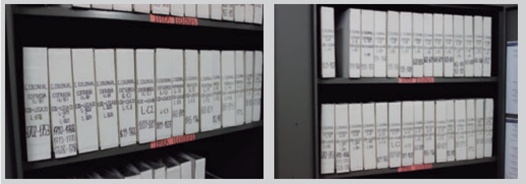
Figs. 5 y 6. Resultado del trabajo de Catalogación del Archivo Histórico del Santuario de Cocharcas que es un fondo documental organizado, inventariado y catalogado.