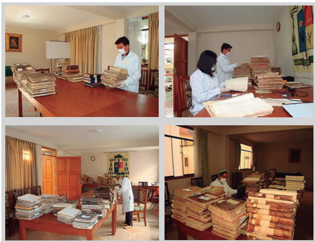
Figs.1,2, 3 y 4. Proceso de la organización y catalogación del Archivo Histórico del Santuario de Cocharcas.