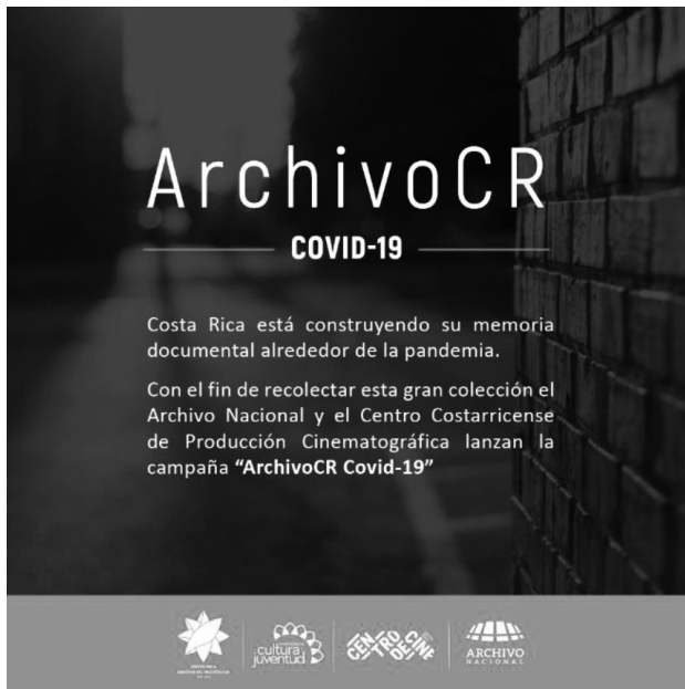
Fig. 3. Archivo CR COVID-19