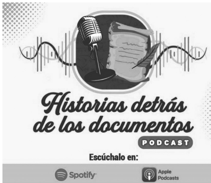
Fig. 2. Historias detrás de los documentos