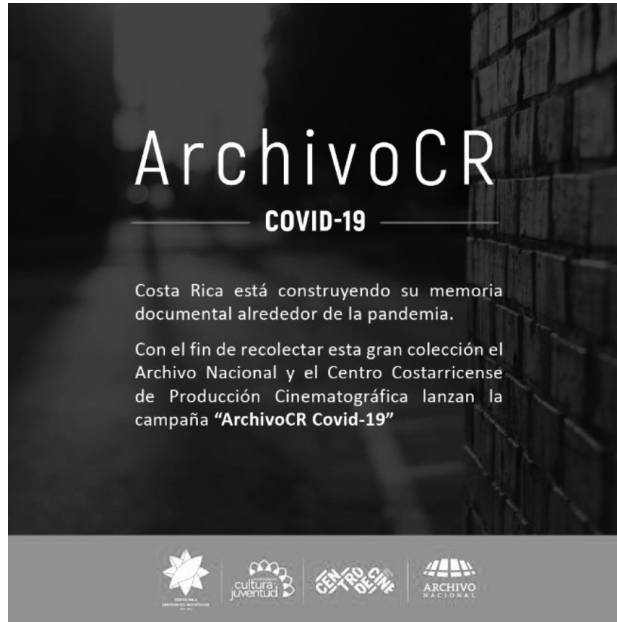
Fig. 3. Archivo CR COVID-19